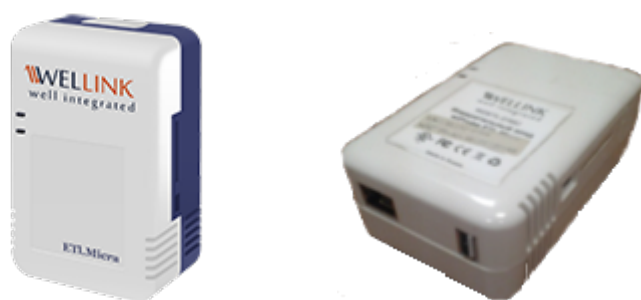
Рисунок 3 — Лицевая панель и разъёмы зонда WPE-108